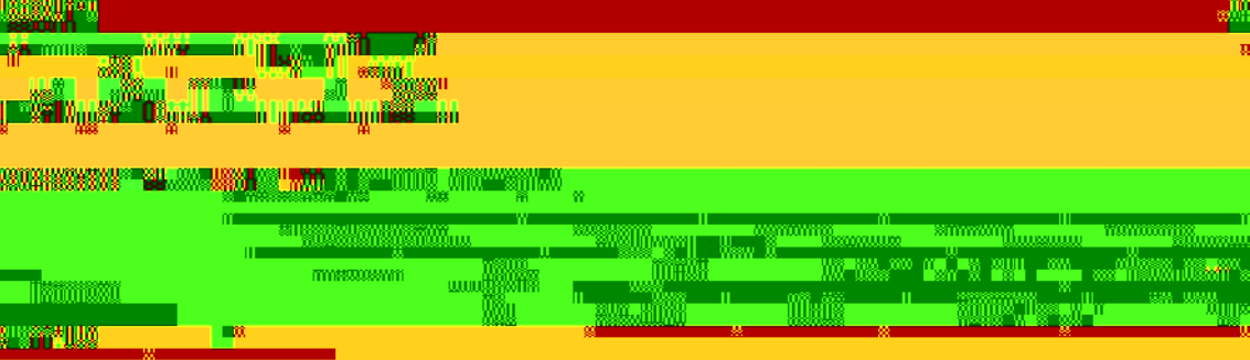
图 3 304 和 316 不锈钢管在不同环境中的耐腐蚀性能